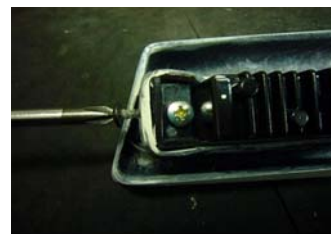
4. インサート KIT に LED デイライトを付属のタッピングビスを使用して正確に固定して下さい。