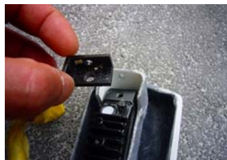
2. C の字のステーを図の様に仮合わせして下さい。