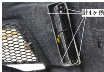
8. 付属のタッピングビスを使用してエアロバンパーにインサート KIT を正確に固定して下さい。

LED デイライトをインサート KIT の内側から仮合わせをし、正面から見て LED デイライトの合いを確認し付属品を使用して LED デイライトをインサート KIT に固定して下さい。完成したインサート KIT をエアロバンパーの外側から仮合わせをし、合いを確認して上図の手順で正確に固定して下さい。付属のネットを正確にカットしてエアロバンパーに固定して下さい。