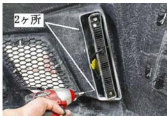
6. 図の様にあらかじめドリルで固定位置を決めておく作業がスムーズです。