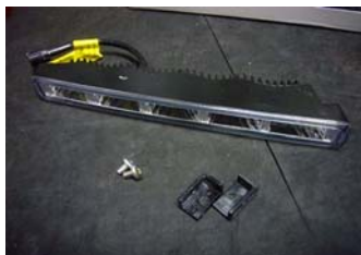
1. まず最初に LED デイライトに C の字のステーを固定します。