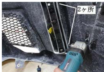
7. 左右 2ヶ所ずつ、固定位置を決めて下さい。