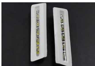
5. インサート KIT の完成。