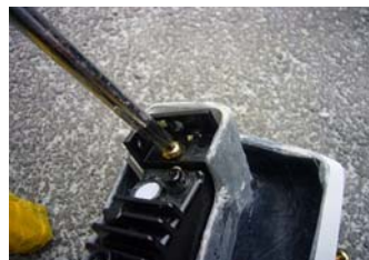
3. 付属のなべネジを使用して LED デイライトに C の字のステーを正確に固定して下さい。